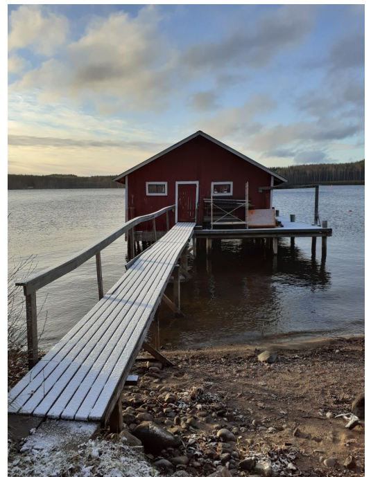
Kaukaantien venekuuri Puumalanvirran rannalla.