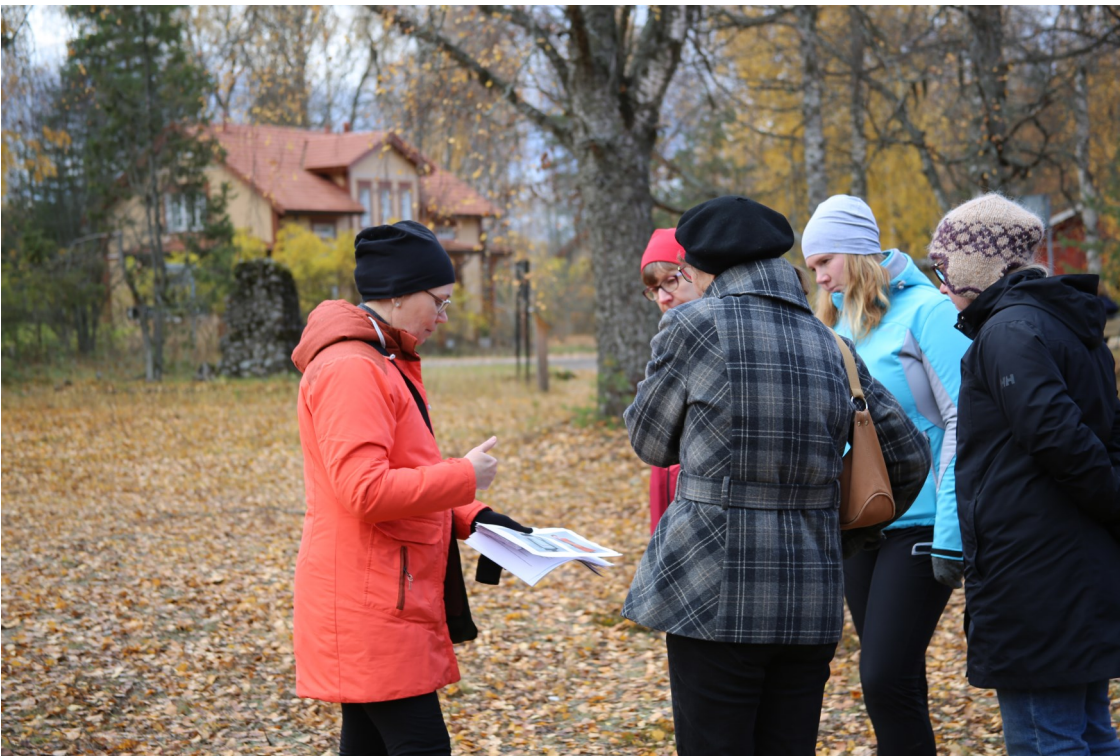
Maisemapäivän kävelyllä 20.10.2022 tutustuttiin mm. Tuukkalan kalmistokenttään Mikkeliissä.