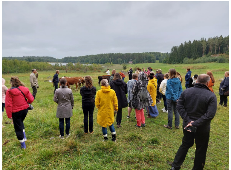
Kulttuurimaisemanhoidon neuvottelupäivien retkeily Mikkeli- sä.

Yhteiskehittämistä olisi selvästi kaivattu enemmän Savonlinnassa esim. työpajojen muodossa. Ta- pahtumien järjestäminen hankkeen puitteissa on ongelmallista, koska rahoituksen päättyessä niiden jatko riippuu omistajuudesta ja kertaluonteisesta järjestämisestä voi olla vaikeaa tehdä johtopäätöksiä tapahtuman menestymisen edellytyksistä. Ehkä painopistettä olisi hyvä siirtää jatkossa tuotteistami- sen tukemiseen ja toimia ensisijaisesti olemassa olevien verkostojen puitteissa – Etelä-Savon ruoka- klusteri voisi tuoda elintarvikepuolelle pitkäjänteisyyttä ja parantaa toimijoiden sitoutumista yhteistoi- mintaan. Ideoiden ja ratkaisumallien dokumentointi hankkeissa helposti omaksuttavaan ja siirrettä- vään muotoon olisi tärkeää – kaikessa ei voi olla aina mukana, mutta vaikkapa 2022 Savonlinnassa järjestettiin kekrijuhlia ja olisi voitu kehittää yhdessä Pien-Toijolan kanssa sisältöjä kekrijuhlaan ja ar- vioda toteutusta & siirtää niille joita kiinnostaa järjestää – toivottavasti tällaisesta osaamisen siirrosta saataisiin vielä kiinni, myös Geoparkin ja Astuvansalmen kehittämiskokemuksia voisimme siirtää Sa- vonlinnaan. Ehkä hankkeessa on ajateltu tätä hyvien käytänteiden siirtämistä?