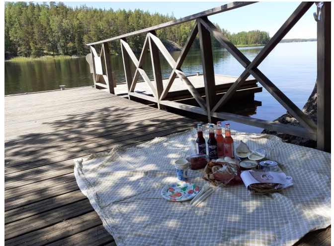
Geofood-henkiset retkievät Astuvansalmella.

Maiseman tuotteistus eli alueen luontoon, historiaan, kulttuuriperintöön ja kulttuuriympäristöön liittyvä erilaisten palvelujen ja tuotteiden kehittäminen on edelleen melko tuntematonta yrittäjien keskuudessa. Aihepiiri on hyvin laaja, käytännössä rajaton, joten sen tehokkaamman hyödyntämisen kautta on luotavissa työtä ja toimeentuloa yhä uusille yrittäjille. Samoin kuin jo toimivien yritysten toimintaan on saatavissa lisäarvoa maiseman tuotteistuksen avulla. Maiseman tuotteistusta voi tehdä laajempien kokonaisuuksien osana, kuten vaikkapa Saimaa- tai D.O.Saimaa- aiheilla. Yksittäinen toimija saa lisänäkyvyyttä yhteisen markkinoinnin avulla, suuremman teeman yhteydessä. Vaihtoehtoisesti maiseman tuotteistusta voi hyödyntää yksittäisen yrityksen tasolla ammentamalla ideoita ja sisältöä yrityksen omasta historiasta, omistajiensa tarinasta, kyseisen tilan tai kylän ominaispiirteistä jne. Yrittäjien kiinnostuksesta ja lisätiedon tarpeesta kertoo mm. hankkeessa järjestettyjen webinaarien yhteydessä tehdyt kyselyt, osallistujilta kysyttiin mm. toiveita aiheista, joista kaivataan lisätietoa. Esille nousi mm. ruokapalveluiden tuotteistaminen, matkailupalveluiden ja tuotteiden kehittäminen sekä kulttuurihistoria.