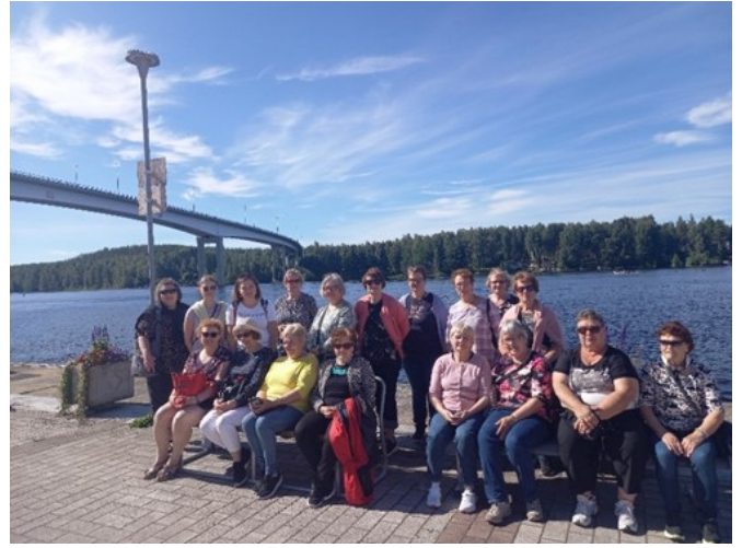
Saimaa Geoparkin Geofood-logo. Eteläpohjalaisia vieraita tutustumassa geofoodiin ja Saimaa Geoparki Puumalassa.