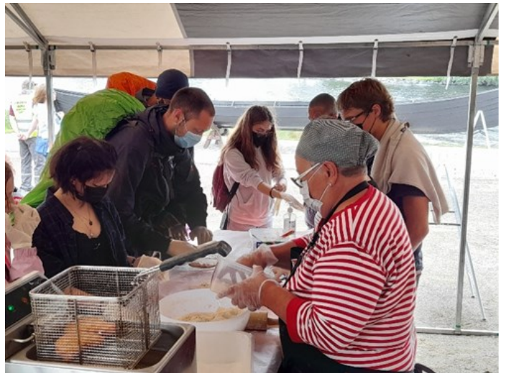
Karjalanpiirakkapaja ja lörtsy-paja Kelluva kalakukko -tapahtumassa Savonlinnan Riihisaassa.

Saimaa Geopark sai hankkeen kuluessa kansainvälisen Unescon Global Geopark statuksen. Vespaikassa edistettiin SGP:n tunnettuutta ja etenkin Geoparkeihin liittyvän geofood-käsitteen tunnettuutta. Geofoodista järjestettiin infoja ja työpajoja yhteistyössä Saimaa Geoparkin kanssa. Tilaisuudet oli suunnattu erityisesti yrittäjille, mutta myös kaikille kiinnostuneille. Esimerkiksi yrittäjille suunnattuun Geofood-työpajaan osallistui useita matkailuyrityksiä, ja työpajan tuloksena syntyi ideoita geofood-retkieveiksi: