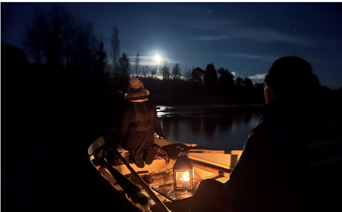
Hankkeessa tuotettiin tuulastusaiheista materiaalia ja kehitettiin siitä mm. luontoystävällinen versio, valotuulastus.

Hankkeella osallistuttiin Saimaa-Ilmiön puitteissa esille nousseeseen European Region of Gastronomy -yhteistyöhön ja verkoston kehittämiseen. Saimaan alueelle myönnettiin Saimaa European Region of Gastronomy -status vuoden 2022 syksyllä.