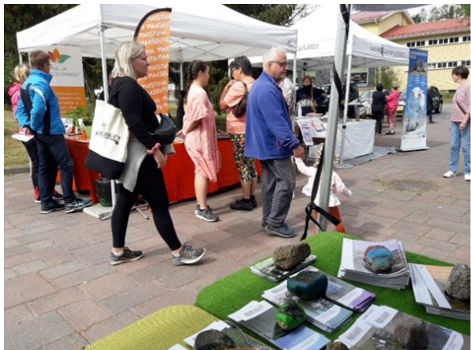
Saimaan saaristoluontopäivät järjestettiin Savonlinnan Riihisaarella ja Mikkelissä, Anttolan satamassa.