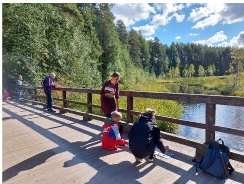
Retkeilijöitä Annilansaaren rantaniityllä (vas.) ja taidetuokio Pankajoella.