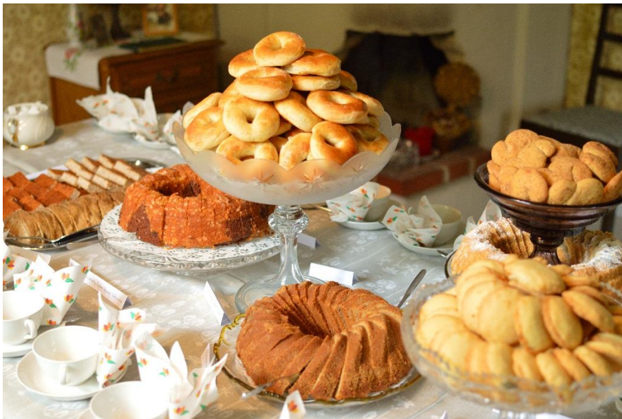
Juvalla Kaskiin kestikievarin kahvipidoissa 9.7.2018 kahvipöytään oli katettu Hiismäen kestikievarinemännän resepteillä toteutetut tarjoilut.

Honkolan koululla Äänekoskella vietettiin Vanhan ajan koulupäivää leipoen litukkarieskaa ja leikkien perinneleikkejä. Pihalla istutettiin omenapuita ja marjapensaita. Koulu täytti 80-vuotta ja koulun historiaa käytiin läpi vanhojen kuvien ja entisten oppilaiden tarinoiden kautta.