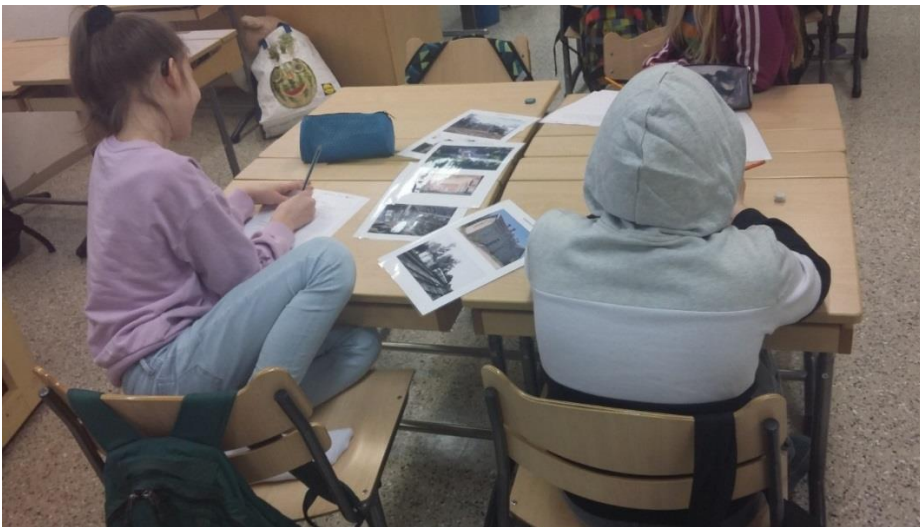
Kulttuuriympäristö tutuksi - kulttuuriympäristötyöpaja Leppäveden koululla, Laukaa 18.2.2019.

”Aiheiltaan juuri sopiva kuudesluokkalaisille ja edistää myös yhdessä tekemisen taitoja.”