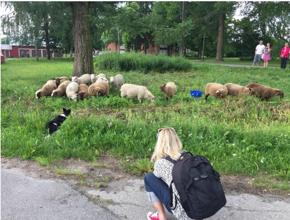
Aidattoman laidunnuksen näytös Mikkelin Otavassa 3.7.2016.

Aidatonta laidunnusta esiteltiin myös vuonna 2017 Mikkeliissä Kokkovouren niityllä, missä kaatosateesta huolimatta kävi yli 40 ihmistä tutustumassa paimenkoirien työskentelyyn, laiduntaviin lampaisiin ja perinnebiotooppien hoitoon. Etelä-Savon ELY-keskus viestintäharjoittelija teki tapahtumasta videon, joka löytyy: https://www.youtube.com/watch?v=Nv960EhFI_Q