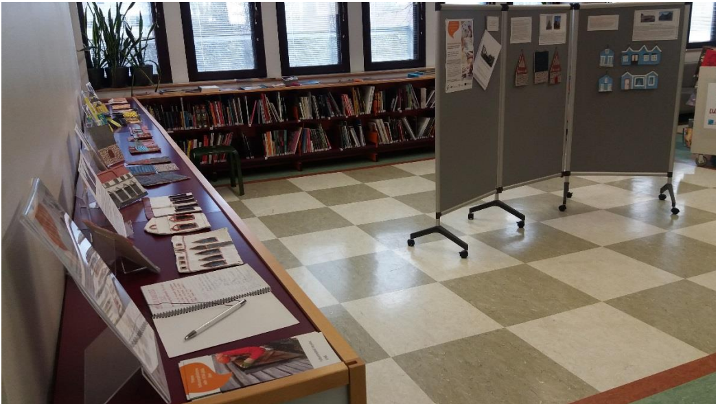
Mikkelin kauneimmat talot - kuvataide- näyttely Mikkelin kirjastolle 18.4.- 2.5.2017.

”Tuli tietoa siitä, miten laaja käsite kulttuuriympäristö on eli mitä kaikkea siihen kuuluu.”