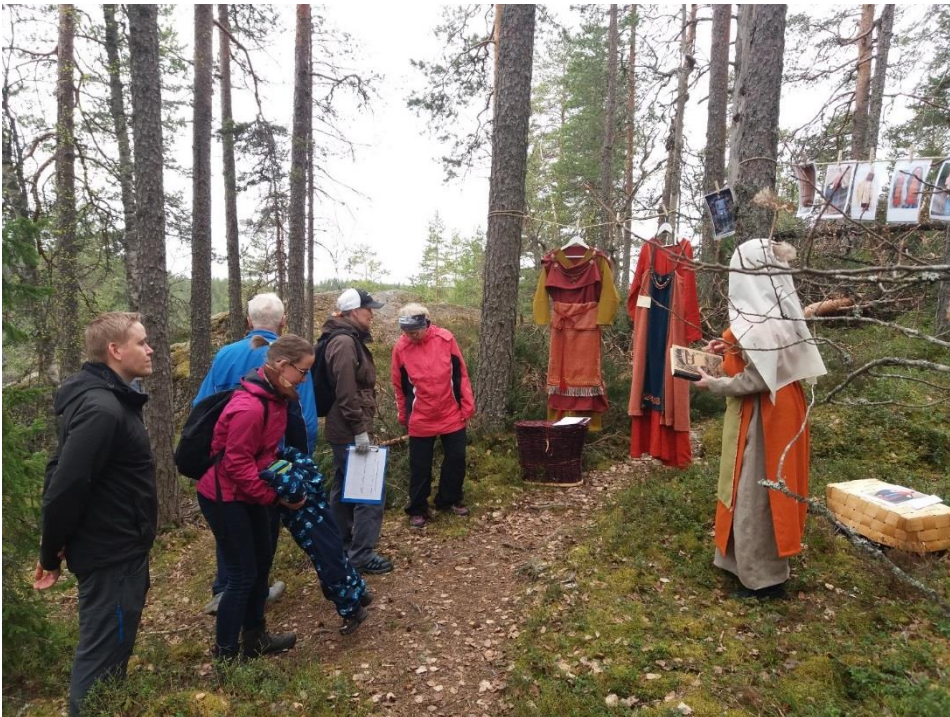
Sulkavan linnavuorella Makuja muinaismaisemassa -tapahtumassa 20.5.2017 esillä oli mm. muinaispukuja.

Hankkeen järjestämissä Syödään yhdessä kulttuuriympäristössä -tapahtumissa esiteltiin esimerkkejä erilaisissa kulttuuriympäristössä järjestettävistä eri sisältöisistä tapahtumista. Tavoitteena oli tarjota ideoita ja herätellä katsomaan omaa toimintaympäristöä uusin silmin. Sulkavan linnavuorella järjestetty Makuja muinaismaisemassa -elämystapahtuma muinaispukuinen ja -ruokineen sisälsi elämyksellistä ja kokemuksellista historian elävöittämistä ja tarjosi monenlaista tietoa entisajan elämästä. Tapahtumaan osallistuneilta kyselyn mukaan jäi päällimmäisenä mieleen vaikuttavat, upeat maisemat, hyvä ruoka, hyvät, asiantuntevat oppaat, historia ja kiinnostavat rastit. Kysyttäessä, millaisen linnavuoreen liittyvän palvelun he voisivat olla kiinnostuneita ostamaan, eniten vastauksia saivat ruokailu, laiva- ja venekuljetus tai risteily sekä historiaopastus. Ehdotuksissa oli myös mm. työhyvinvointitapahtuma yrityksille, historiallinen näytös ja kännykkäsovellus.