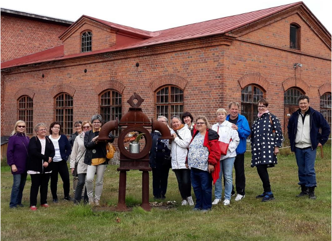
Euroopan kulttuuriympäristöpäivän retki Pieksämäelle Sylvi Kekkosen puistoon, Pieksämäen veturitalleille ja Haapakosken ruukkiin 7.9.2019.

Hankkeessa pidettyjen työpajojen ja infojen tavoitteena oli kertoa miten kulttuuriympäristöjä voi hyödyntää. Esimerkiksi matkailijat arvostavat aitoja elämyksiä ja aitoja tarinoita, joita paikallinen kulttuuriympäristö voi tarjota. Hyvänä esimerkkinä ovat paimenlomainfot, joista on oltu erittäin kiinnostuneita. Infojen myötä yrittäjät ovat lähteneet toteuttamaan toimintaa omissa yrityksissään.