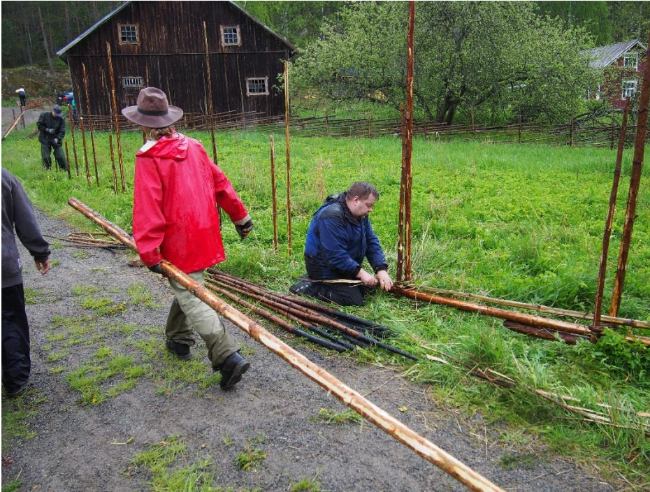
Riukuaitatalkoot Hiidenmaan torpan pihapiirissä järjestettiin yhdessä Metsähallituksen kanssa 21.5.2016. Kohde on yksi Metsähallituksen paimenlomakohteista.