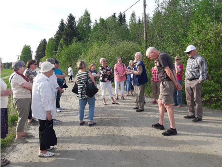
Retki Jyväskylän Kuukanpään maisema-alueelle, joka on ehdolla valtakunnallisesti merkittäväksi maisema-alueeksi. Jyväskylä 22.5.2018.

Myös valtakunnallisesti merkittäväksi maisema-alueeksi ehdolla olevalle Jyväskylän Kuukanpään kulttuurimaisema-alueelle tehtiin retki. Retkellä saatiin tietoa valtakunnallisesti arvokkaista maisema-alueista ja sen merkityksestä, tutustuttiin alueella toimivaan ja viljelymaisemaa ylläpitävään siemenviljelytilaan ja -pakkaamoon sekä Kuukasojan siirtolaisalueeseen, jonne asutettiin Sortavalasta tulleita siirtolaisia.