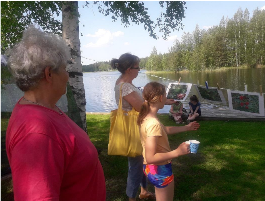
Vieraslajien tunnistusta Pertunmaan kyläpäivässä 8.6.2019.

KYNÄ tiedotti aktiivisesti mm. Maa- ja kotitalousnaisten Vuoden maisemateko-kilpailusta, jossa teemana vuonna 2019 oli Suuret suomalaiset vieraslajitalkoot, sekä teki yhteistyötä mm. Suomen Luonnonsuojeluliiton vieraslajien torjuntaan liittyvän Viekas LIFE -hankkeen kanssa tiedottamalla hankkeesta ja sen tapahtumista. Aihe oli esillä myös muissa hankkeen tapahtumissa ja toiminnassa. Näiden toimien myötä on siis konkreettisesti poistettu vieraslajeja ja ennen kaikkea on saatu vieraslajitietoisuutta leviämään laajalti.