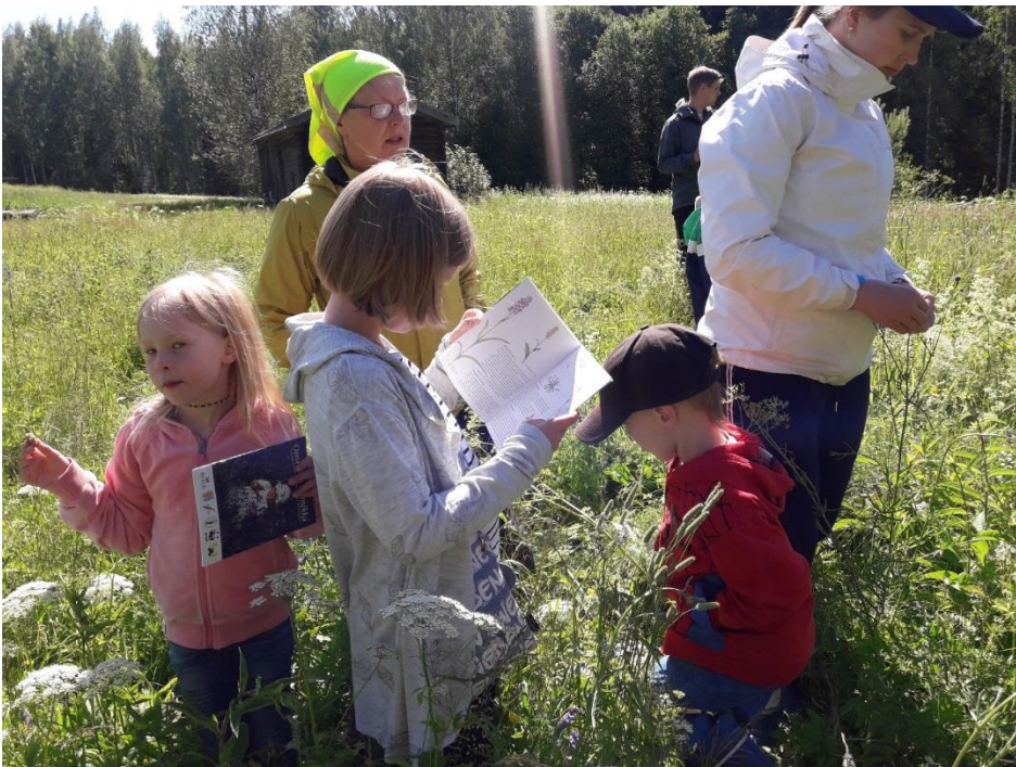
Perinnebiotooppi- inventointia kiinnostuneille Savonlinnassa, Punkaharjun kotiseutumuseon niityllä 31.7.2019.

Niityn elämää -materiaalia käytettiin mm. Laitumelle lasku -tilaisuuksissa Jämsässä ja Korpilahdella ja Suomen luonnon päivän tilaisuuksissa Muuramessa, Petäjavedellä ja Äänekoskella, kun kerrottiin laiduntamisen hyödyistä ja niittyjen ja monimuotoisuuden vähenemisestä.