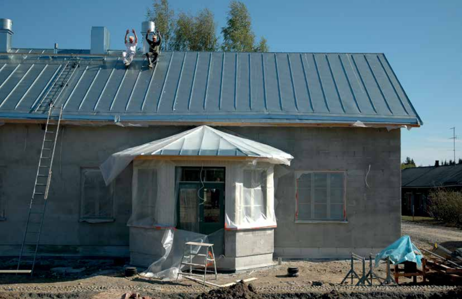
Tertin kartanon kahvilarakennus on vanhaan miljööseen sovitettu uudisrakennus.