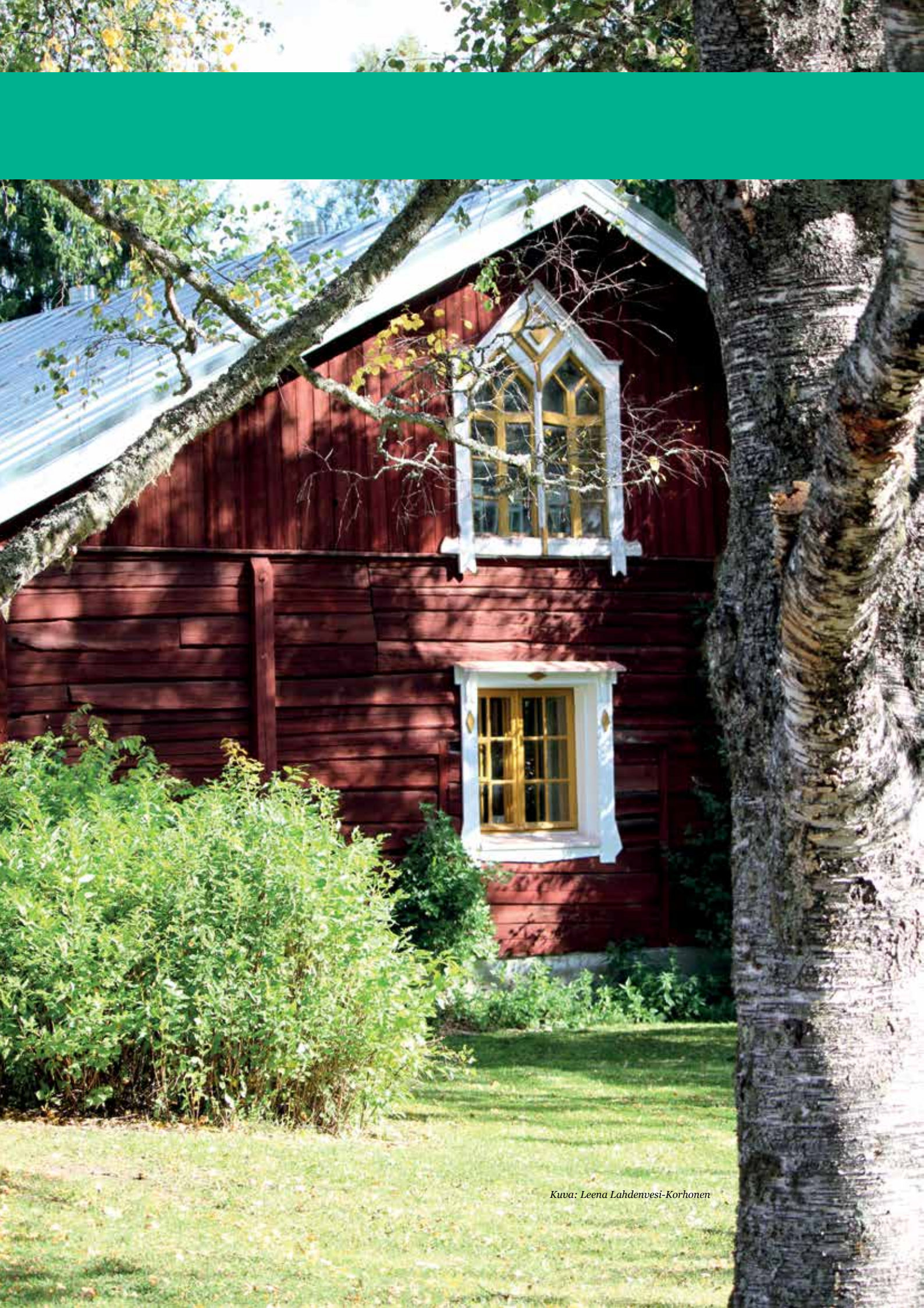
Kuva: Leena Lahdenvesi-Korhonen