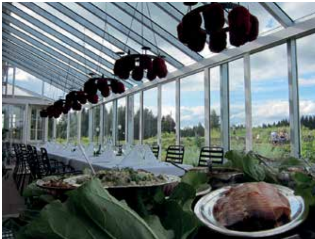
Kuva: Tertin kartano