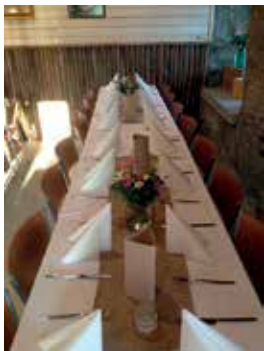
Kuvat: Lemettilän tila