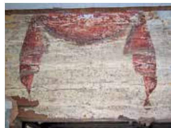
Päiväkotikäytön ajaksi sisäseinien ja lattiaan asetettujen lastulevyjen alla olivat säilyneet alkuperäiset koristekuvioiset puulattiat ja seinämaalaukset, jotka saatiin ennallistavan peruskorjauksen myötä kunnostettua.