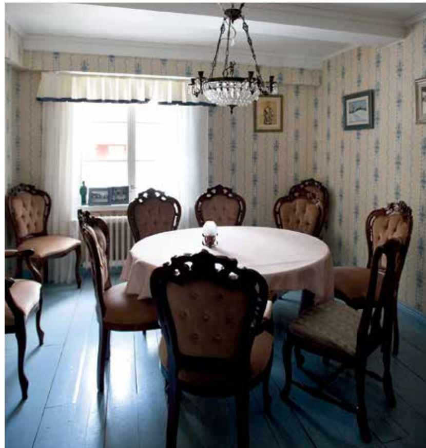
Kuva: Taulun kartano

Eri puolilla Suomea toimii Leader-yhdistyksiä, joiden tarkoituksena on kehittää paikallista toimintaa tarjoamalla neuvontaa ja rahoitusta. Leader-yhdistysten kautta voi saada EU-tukea yleishyödyllisiin hankkeisiin, kuten ympäristö- ja kulttuurikohteiden kunnostamiseen. Tukea voi hakea kaikille avoin rekisteröitynyt yhdistys, säätiö tai julkisoikeudellinen yhteisö. Yrittäjät voivat hakea Leader-rahoitusta maaseudun yritystoimintaa monipuolistavien yritysten perustamiseen, kehittämiseen ja laajentamiseen. Leader-yhdistysten avustuksilla on jatkuva haku. Tukea haetaan EU-hankehakemuksella.