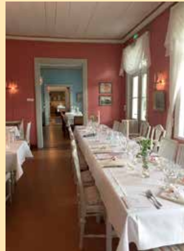
Kuva: Pappilan Pidot

Päästä Pappilan Pitoihin, julkisuuteen juhlahuoneen. Tulla talon tunnelmahan historiaa häilyväiseen. Maistelemaan mieluhista, suurusta suunmukaista. Tehdä tilaa tunteille muistojen maaperäksi. Valaa viertä Vanhan Keuruun, Kameleontinkin keralla.”