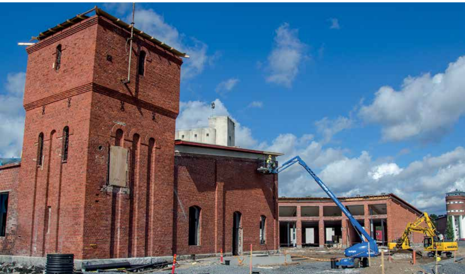
Pieksämäen vanhat veturitallirakennukset uudistettiin liiketiloiksi.