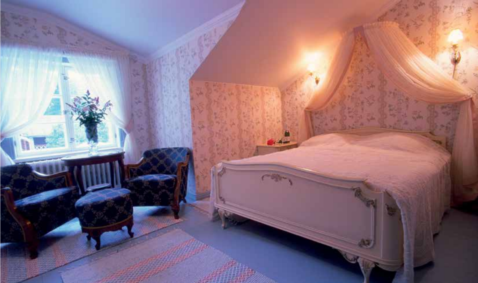
Kuva: Taulun kartano

talon tuoksu, aikojen saatossa sileäksi kulunut pöydän pinta ja satavuotiaaseen juureen leivottu ruisleipä. Vanha rakennus ja siihen liittyvät palvelut voidaan suunnitella paitsi visuaalisesti yhtenäiseksi kokonaisuudeksi, myös ääni-, tuoksu- ja maku-maailmaltaan perinteiseen miljööseen sopivaksi ja sitä kunnioittavaksi. Yllätykselliset yksityiskohdat, kuten koristeena käytetyt alkuperäiset vanhat esineet syventävät kokemusta. Myös toimintaan liittyvän markkinointi- ja viestintämateriaalin tulee olla yhteensopivaa rakennuksen tunnun kanssa.