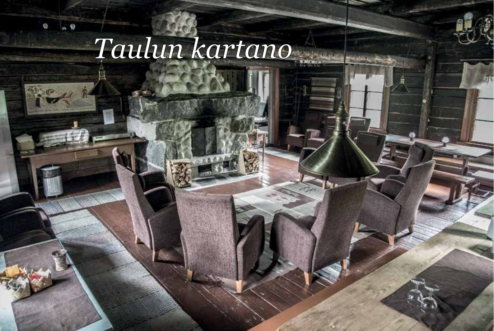
Saunarakennuksen kuvat: Taulun kartano