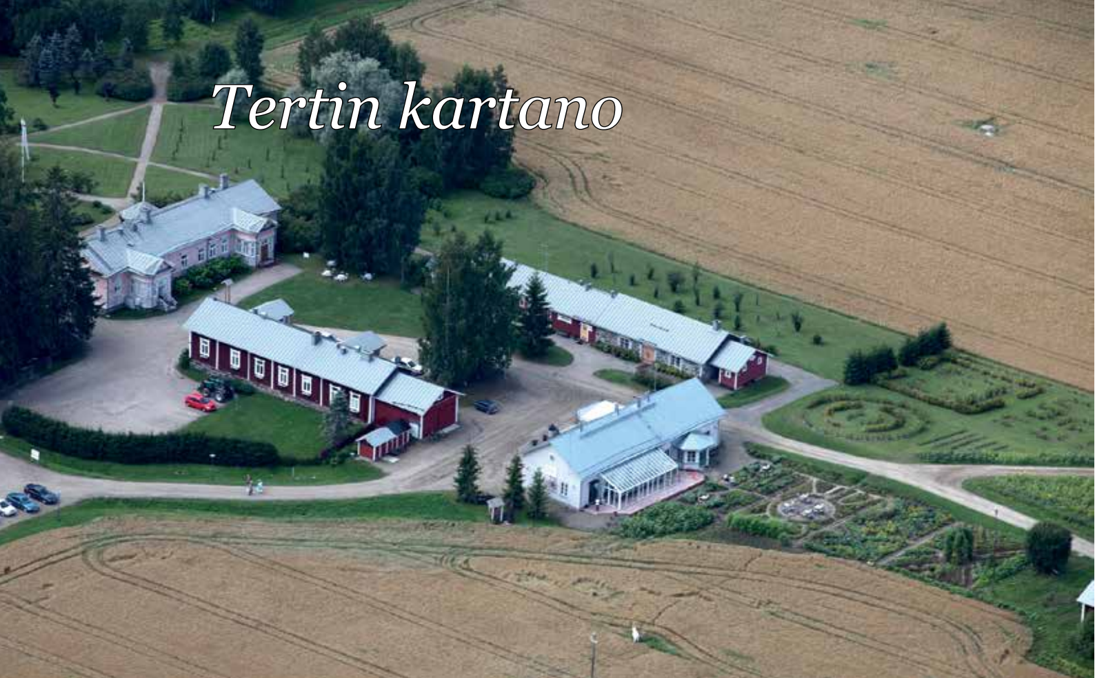
Kuva: Tertin kartano