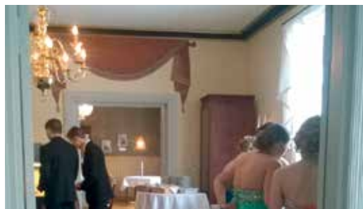
Kuva: Pappilan Pidot

Rakennuksen julkisivuun ei oltu vuosikymmenten aikana tehty muutoksia, joten sen ennallistus ei vaatinut suuria toimenpiteitä. Verantojen laho- vauriot korjattiin, homeiset maalipinnat raapattiin puupinnalle ja ulkopinnat öljymaalattiin. Vesikatto maalattiin, piiput pellitettiin ja katon turvavarus- tusta kohennettiin. Alapohjan vauriot korjattiin ja lattiasienien vaurioittamat rakenteet korvattiin uu- silla. Keuruun kaupunginpuutarhuri laati vanhalle pappilapuutarhalle puutarhasuunnitelman, jonka mukaan puutarha kunnostettiin ja sinne istutettiin uudelleen vanhoja perinnekasveja.