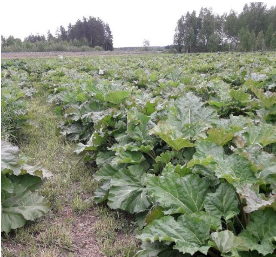
Kuva 6: Raparperikasvuston ensimmäinen sadonkorjuu on noin kahden viikon päästä.

Tilalla viljellään myös raparperia 0,5 ha alalla. Raparperipellossa taimiväli on 70 cm ja riviväli reilu 1 m. Yleensä raparperista saadaan kaksi satoa kesässä. Viljely on helpohkoa. taimet lannoitetaan keväällä ja kesän ajan rivivälejä leikataan ruohonleikkurilla. Kukkavarsia poistetaan säännöllisesti, jotta lehtiä kasvaisi enemmän. 0,5 ha:n alalta kesän ensimmäinen sato on noin 6000 kg. Seuraava sato on n. puolet alkukesän sadosta. Käsin korjatut raparperit menevät pakastamolle, josta niistä saan n. 0,65 € / kg.